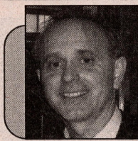
Пише: Бојан Ж. Босилјчић

"Mračni vitez" ("The Dark Knight"), režija: Kristofer Nolan, glavne uloge: Kristijan Bejl, Hit Ledžer, Aron Ekhart, Geri Oldman, Megi Džilenhal, Majkl Kejn, Morgan Friman