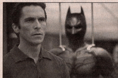
Dualizam superheroja - Kristijan Bejl kao Brus Vejn-Betmen

Autor svetske klase Kristofer Nolan ("Memento", "Insomnija") je u "Mračnom vitez" uspeo da pop-eskapizam približi neprolaznom artizmu. Ovo ostvarenje efektno funkcioniše na više nivoa - kao akcioni film, kao studija karaktera i kao metafora na ovo vreme opsednuto strahom od terorizma. Koncipiran na razmeđu između industrije i umetnosti, mešajući bravuru sa klišeima, "Mračni vitez" je delo o dualizmu, što je i glavna crta njegovih likova.