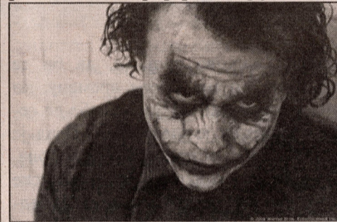
Kandidat za posthumnog Oskara - Hit Ledžer kao Džoker

nom. "Smejanje je najbolji lek" - to je moto Džokera. U "Mračnom vitez", međutim, Ledžerov Džoker je smrtno ozbiljan. On je gospodar jeze, (sado)mazohista i nihilista, otelotvorenje čistog Zla, koji uništava sve što mu se prohte, povodeći se idejom totalnog Ništavila. Džoker je agent haosa, manijakalni anarhista koji živi samo da bi izazvao pustoš. Kao što Betmenov/Brus Vejnov sarkastični batler Alfred (Majkl Kejn) reče: "Neki ljudi jedino žele da vide kako svet gori". Destruktivnih poriva, njega ne interesuje ni novac, ni slava, ni moć, sve što čini je zarad perverzno zadovoljstva. Ledžerov ultraluciferski Džoker se popeo na pijedestal holivudskih negativaca, od kojeg bi i jedan Hopkinsov Hanibal Lekter ("Kad jaganjci utihnu") ustuknuo. Suptilno manipulišući sa krilaticom filma "Zašto tako ozbiljno", reditelj Nolan odbija da objasni lik Džokera simplifikovanom pop-psihologijom, sa